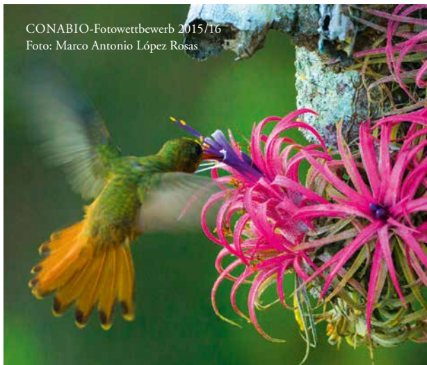
CONABIO-Fotowettbewerb 2015/16

Webseite des Mexikojahrs in Deutschland: www.dualyear.mx Webseite des Deutschlandjahrs in Mexiko: www.alemania-mexico.com