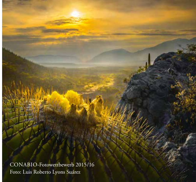
CONABIO-Fotowettbewerb 2015/16